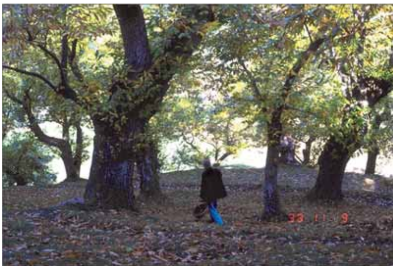
Castagneto tradizionale dell'Alto Mugello al termine della raccolta