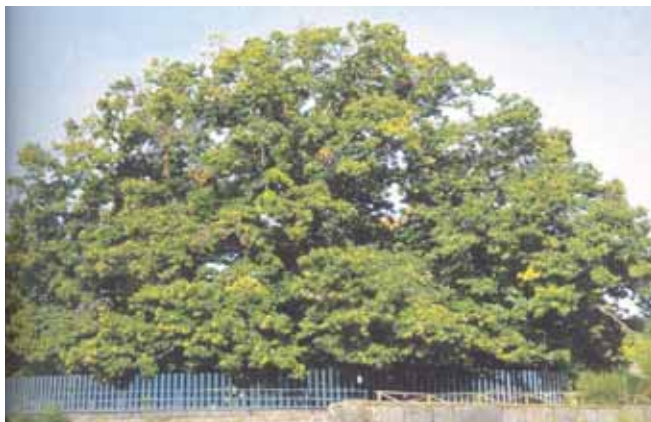
Castagno dei Cento Cavalli, Sant' Alfio (CT). Patrimonio dell'UNESCO dal 2008, con la dichiarazione "Albero Monumento Messaggero di Pace"

9:30 Il Libro Bianco sulla Castanicoltura, a cura di AREFLH, presentato da Jean Luc Bellat