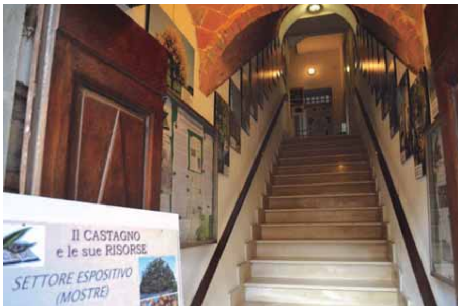
Ingresso e veduta d'insieme dell'Esposizione Permanente sul Castagno del CSDC