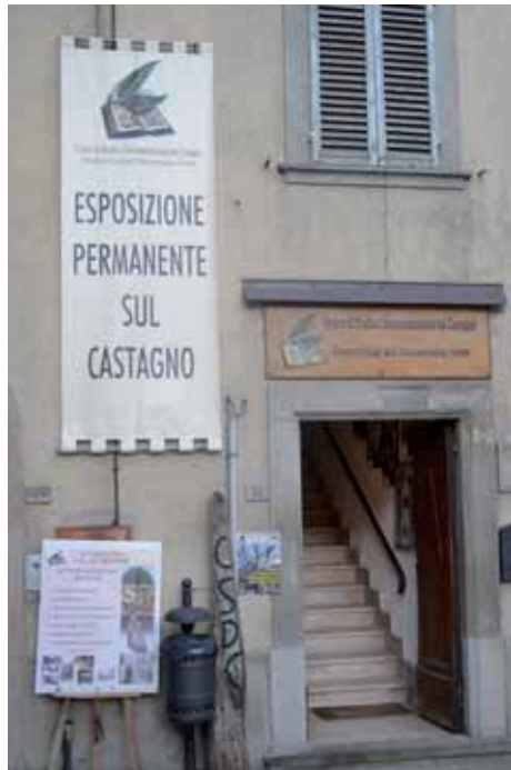
Ingresso al CSDC