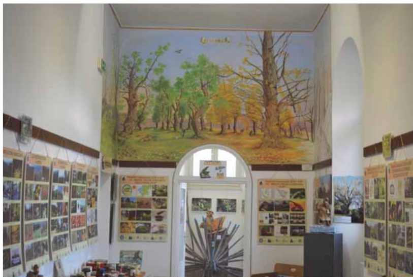
Particolare dell'Esposizione Permanente sul Castagno del CSDC di Marradi