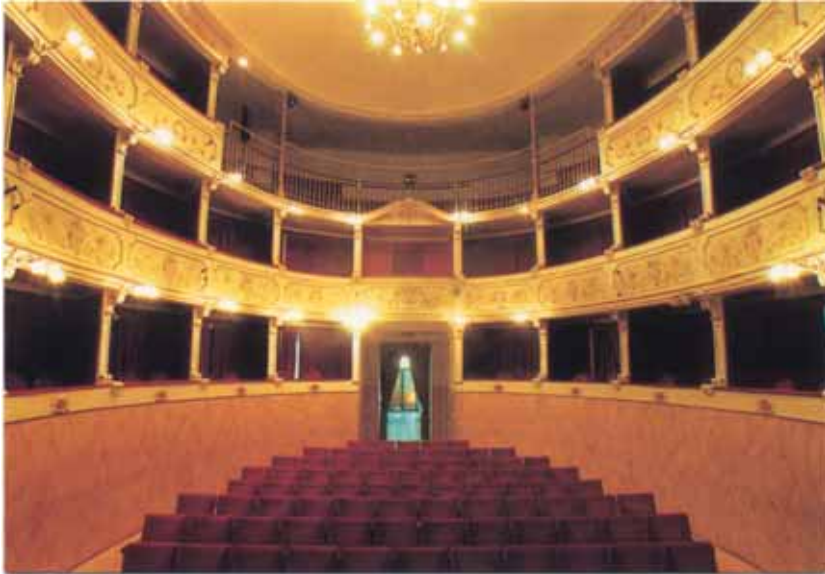
Interno del «Teatro degli Animosi» di Marradi