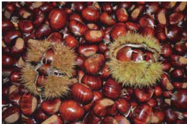
"Marron Buono di Marradi", afferente all'IGP Marrone del Mugello

12:30 Pranzo-Buffer, a cura dell'Associazione Strada del Marrone di Marradi